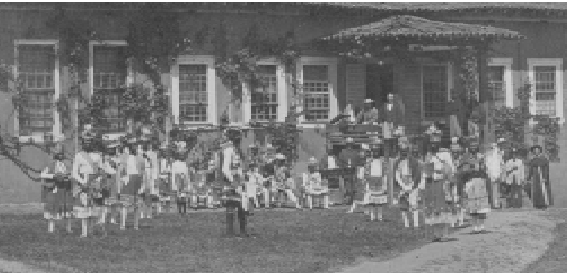
Figura 3: Congada em 1868.